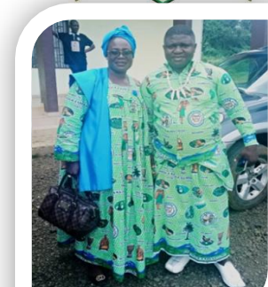
Sortie officielle du pagné des enfants du NLONAKO